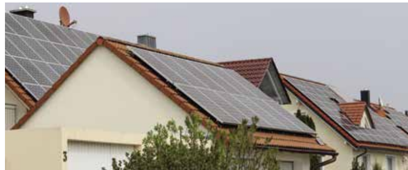
Photovoltaikanlagen gibt es auf vielen Dächern in Pfaffenhofen. Im künftigen Baugebiet Pfaffelleiten wird das nun zur Pflicht.