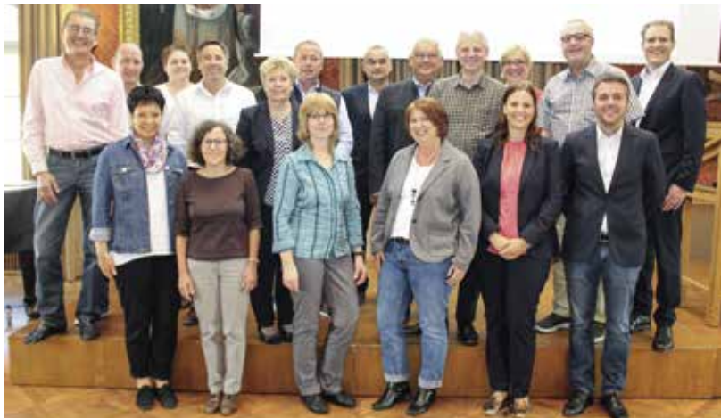
Viele Mitarbeiter sind seit Jahrzehnten bei der Stadt beschäftigt – zum Teil sogar schon seit 45 Jahren. Im Oktober 2018 wurden 21 Dienstjubilare im Rathaus geehrt.