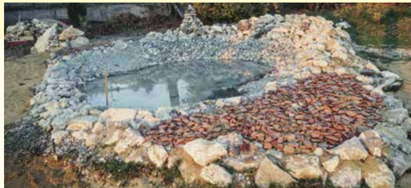
Teichanlage für Pionierarten wie Gelbbauchunke und Kreuzkröte

David Seifert ließ eigens für eine Blühfläche im Zentrum des Gartens den gesamten Humus (ca. 15 Kipp-LKW) abtransportieren und gegen Sand austauschen, damit der Boden mager genug war für eine Blumenmischung, wie sie im nahegelegenen