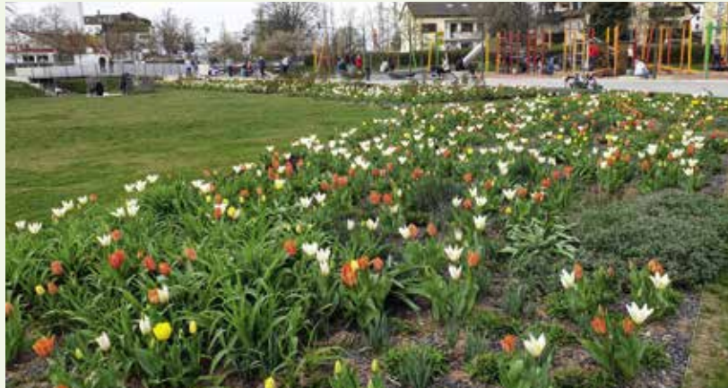
Der Bürgerpark grünt und blüht. Am 25. April werden hier 22 neue Bäume gepflanzt.

Gesucht werden in diesem Zusammenhang noch „Vorzeigegärten“, die als beispielhaft der Öffentlichkeit präsentiert werden können. So werden pflegeleichte Balkonbepflanzungen, Naturgärten und Vorgärten (statt des modernen Kiesgartens) gesucht, außerdem bienenfreundliche Gärten, in denen man nicht gießen muss, sowie