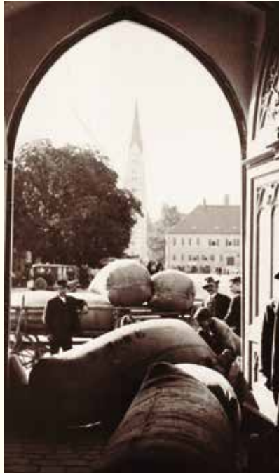
Mitarbeiter der Stadt bei der Hopfenabwaage im Rathaus (um 1930)

Traditionell beschäftigte die Stadt schon in früherer Zeit Straßenaufseher