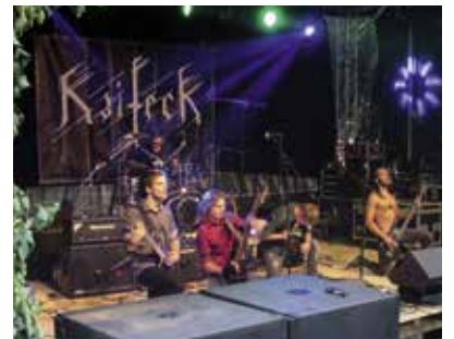
Bands wie Kaifeck sorgen beim Onstage 2019 für einen perfekten Metal-Abend.