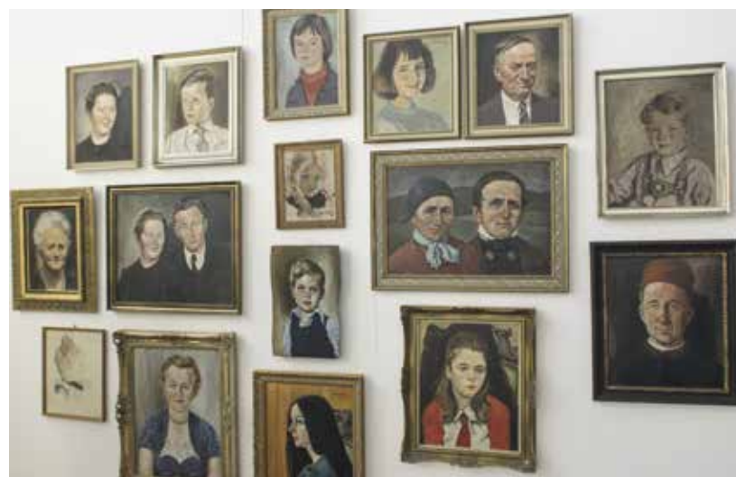
Zahlreiche Bilder von Eduard Luckhaus waren 2010 zu sehen. Für 2020 ist eine ähnliche große Ausstellung mit Werken von Michael Weingartner in Planung.