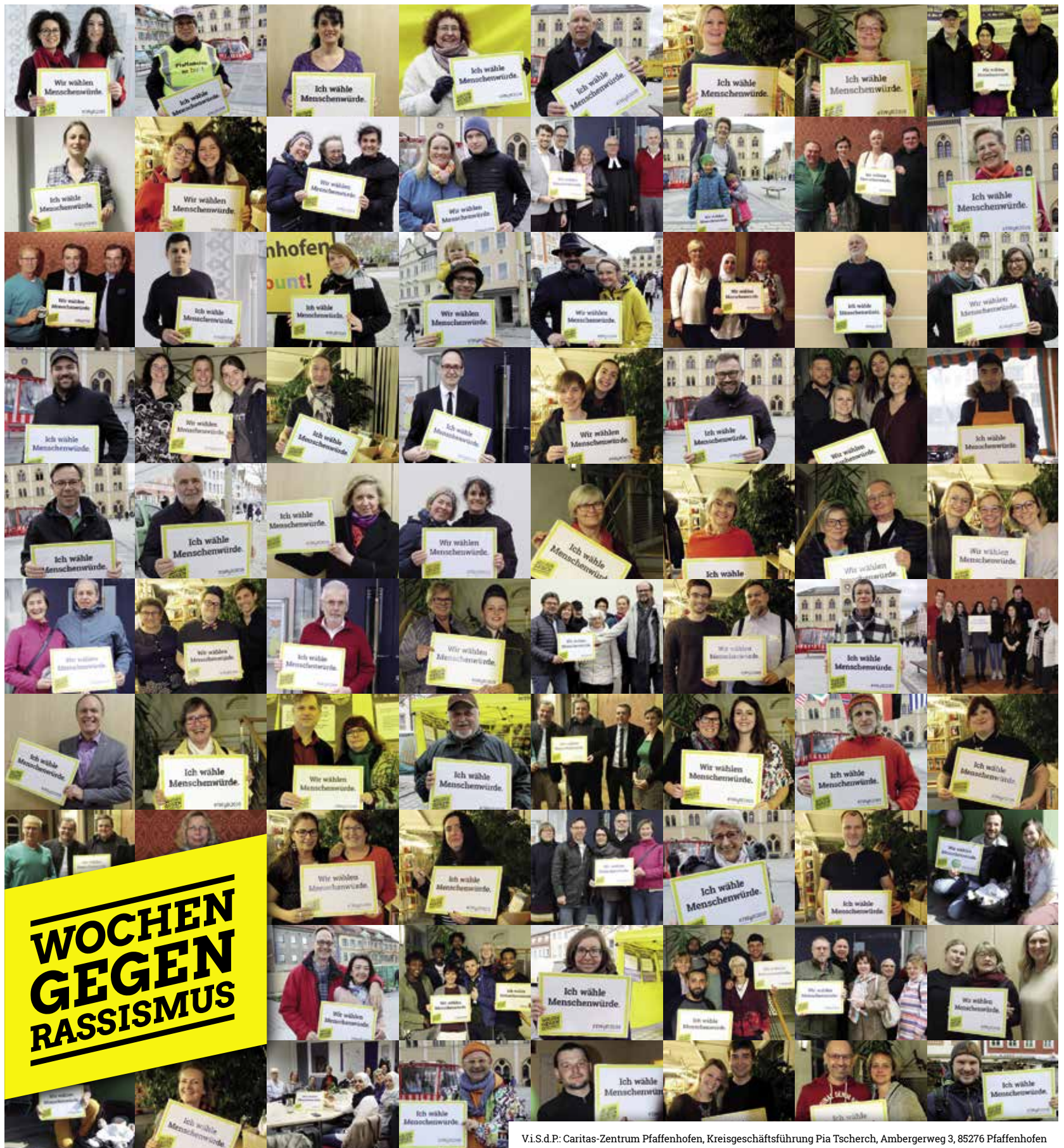
V.i.S.d.P.: Caritas-Zentrum Pfaffenhofen, Kreisgeschäftsführung Pia Tschersch, Ambergerweg 3, 85276 Pfaffenhofen

Die Wochen gegen Rassismus stießen in Pfaffenhofen auf große Resonanz. Die Kirchen und die Caritas, die Stadt und das Landratsamt, Schulen und Kindertagesstätten, Jugendparlament und Kreisbücherei, die türkisch-islamische Gemeinde Ditib und mehrere Vereine boten verschiedenste Veranstaltungen an bzw. unterstützten das Projekt. Viel Anklang fand auch eine Fotoaktion, die deutlich machte, wie viele Menschen sich gegen Rassismus und für Menschenrechte einsetzen. So stellten sich bei den Veranstaltungen zahlreiche Pfaffenhofener mit dem Hinweisschild „Wir wählen Menschenwürde“ vor die Kamera (auch mit Blick auf die Europawahl) und machten damit sichtbar, was jeder in seinem Verhalten anderen gegenüber zeigen sollte: Respekt vor der Würde der anderen Menschen. pafunddu.de/18005