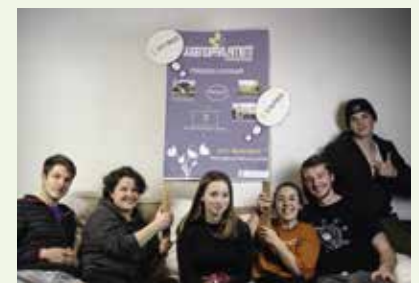
Die Jugendparlamentarier freuen sich auf Bewerbungen.

Gefördert werden können einzelne Projekte, die einen Mehrwert für Pfaffenhofen bedeuten, mit jeweils maximal 3.000 Euro. Wichtig ist den Jugendparlamentariern, dass es um die Stadt Pfaffenhofen und deren Bürgerinnen und Bürger geht. Im Idealfall verbinden die Projekte dabei Jung und Alt miteinander und haben einen nachhaltigen Effekt. Eine zwingende Voraussetzung ist weiterhin, dass diejenigen, die eine solche Förderung bekommen wollen, vom Finanzamt als gemeinnützig anerkannt sind. Es kommen also neben Schulen und Kindergärten auch viele Vereine oder