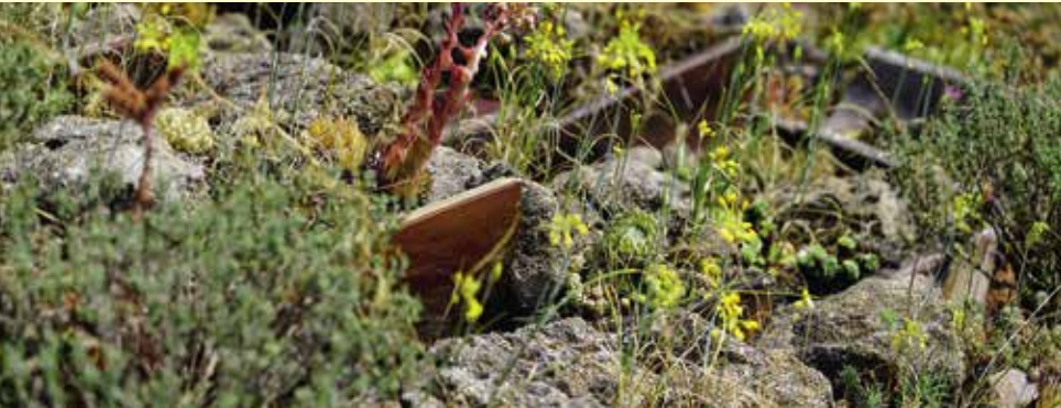
Trockenbeet mit Sempervivum

Was ist so besonders an diesem Garten, dass man dort eine Führung besuchen kann? Der Hortus Statera ist ein moderner Naturgarten, der dem Klimawandel gewachsen und Heimat für einheimische Pflanzen und Tiere ist.